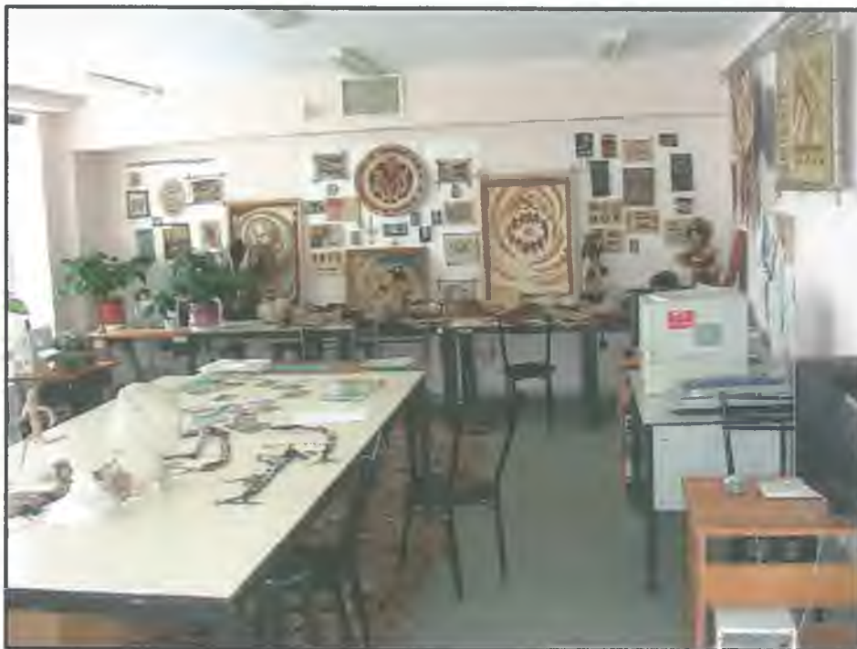
Фото Ц2. Мастерская по меховым и кожным изделиям