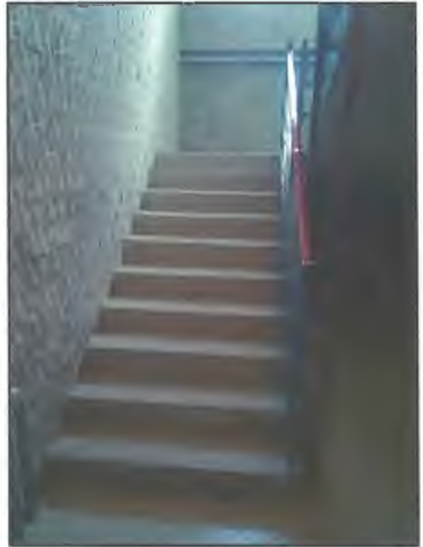
Фото П2. Лестница на II этаж