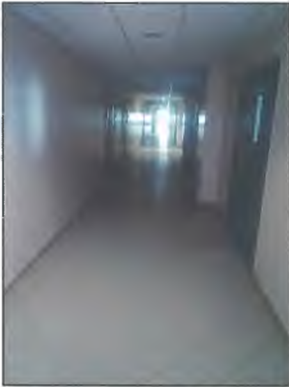
Фото П1. Коридор на I этаже