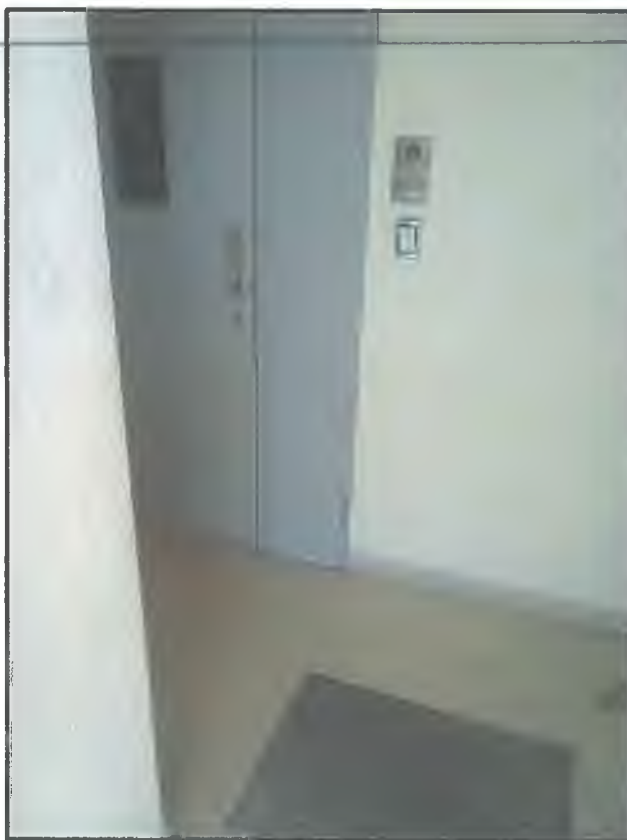
Фото В2. Тамбур