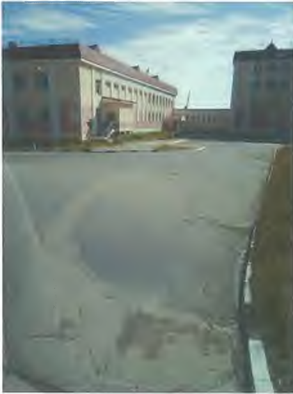
Фото Т1. Путь движения по территории от остановки № 1