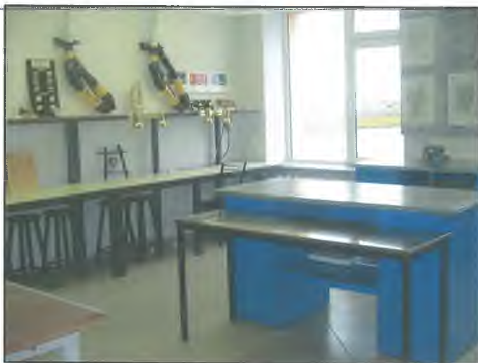
Фото Ц3. Мастерская по обработке кости