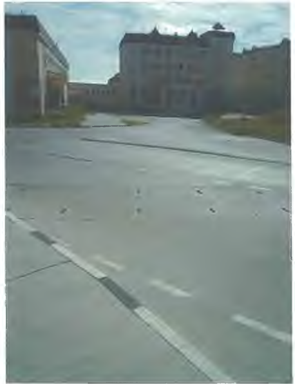
Фото Т2. Путь движения по территории от остановки № 2