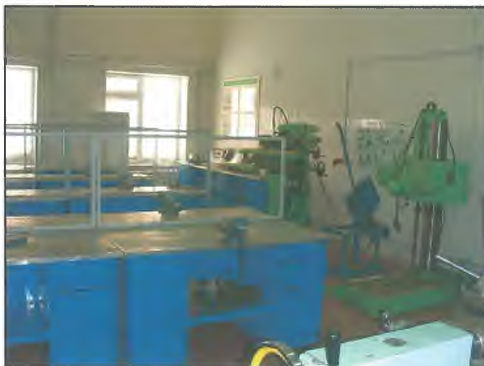
Фото Ц1. Слесарная мастерская