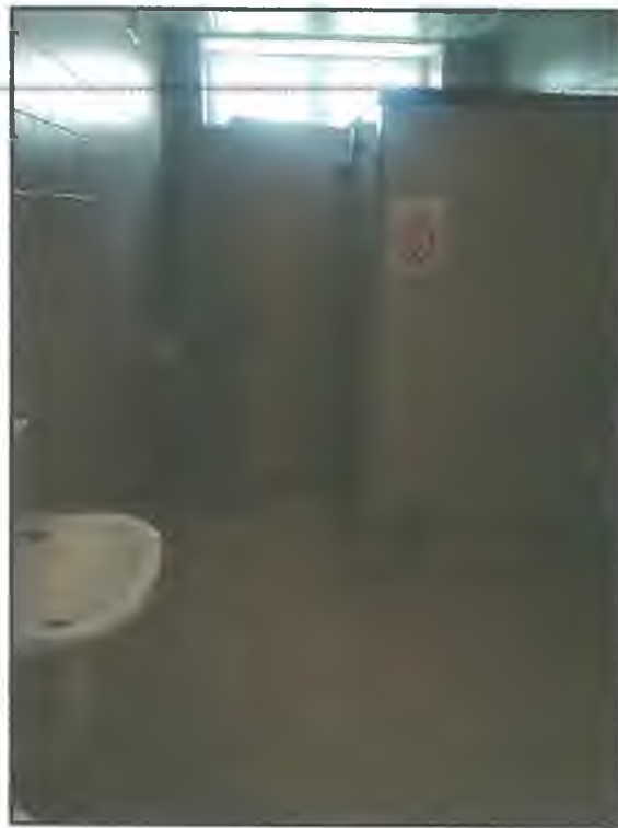
Фото С2. Санузел на I этаже (№26 на плане)