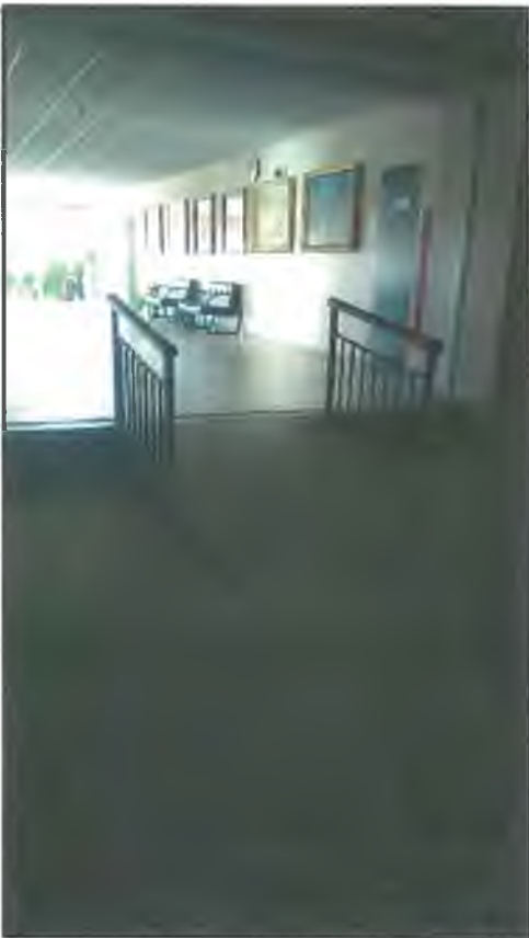
Фото П3. Пандус на II этаже