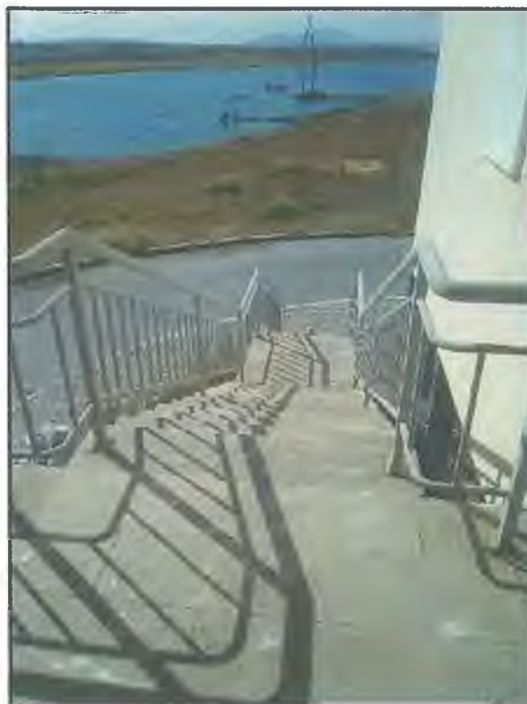
Фото П5. Тамбур № 51 на плане Фото П6. Лестница эвакуационная Зоны целевого назначения здания (целевого посещения объекта)