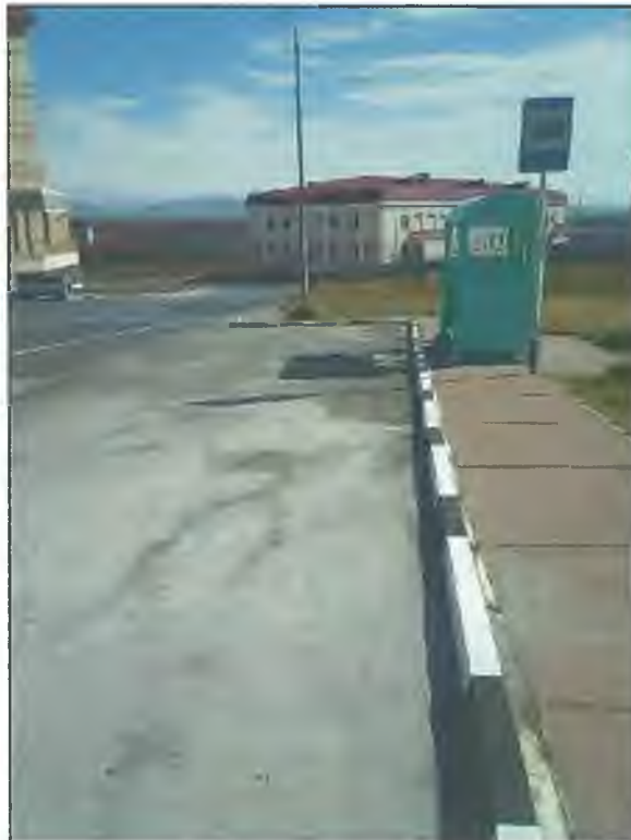
Фото Т3. Путь движения по территории от остановки № 3