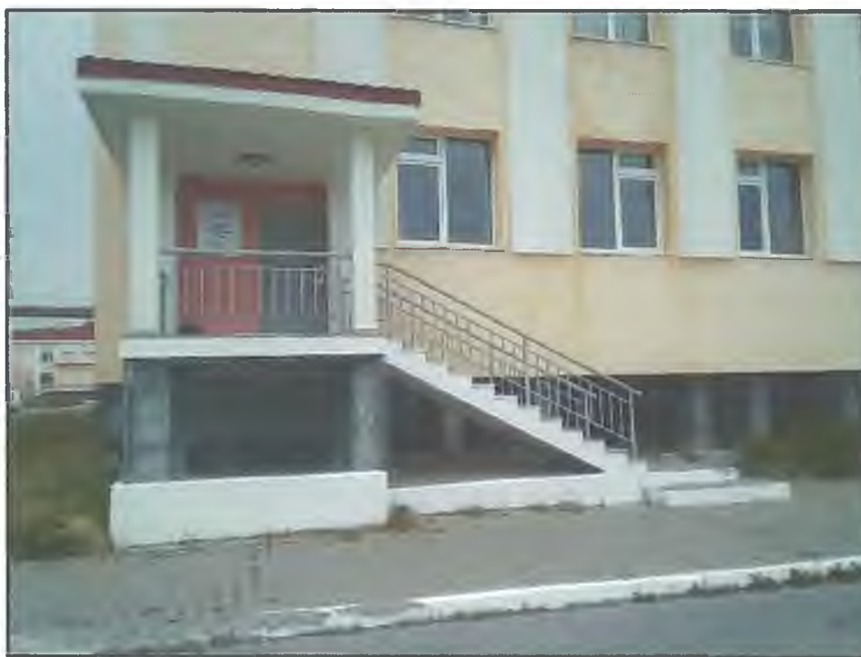
Фото В1. Вход в здание и наружная лестница