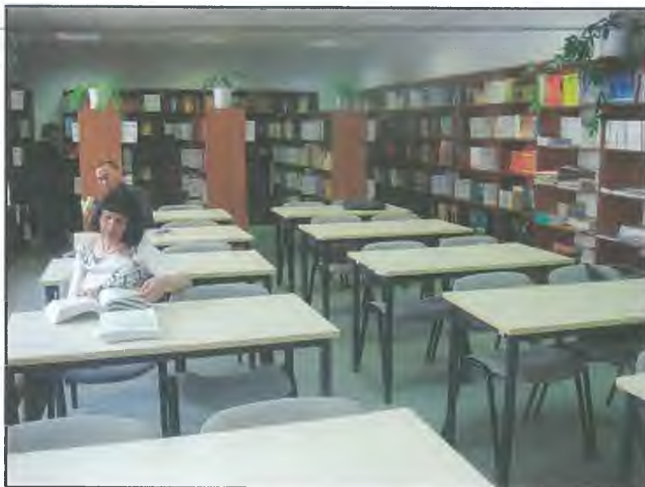
Фото Ц5. Библиотека