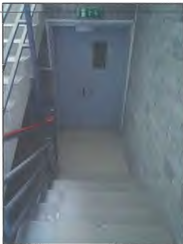
Фото В3. Лестница