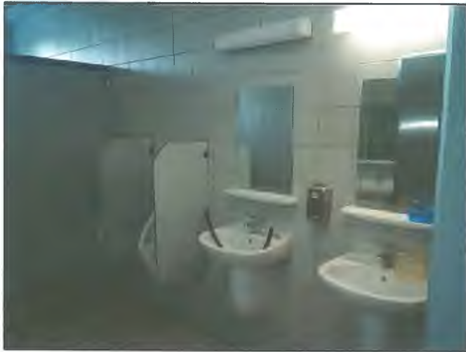
Фото С1. Санузел на I этаже (№26 на плане)