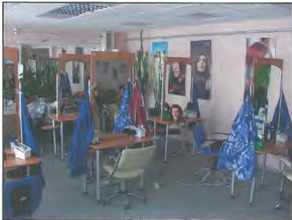
Фото Ц4. Парикмахерская